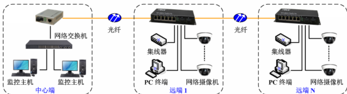
方案一：光纤多点组链型网络